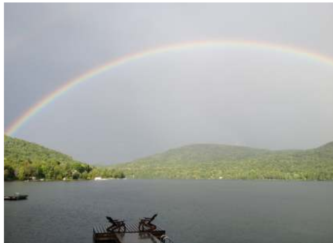
Le mont Grand'Maison